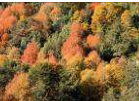
Otoño en la Araucanía