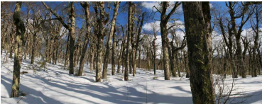
Invierno en bosques de Lenga ( Nothofagus pumilio )