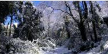
Inverno en el bosque precordillerano de la Araucanía