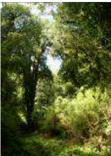
Todos los niveles del bosque templado